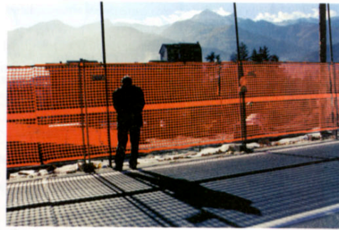
Valle militarizzata. I primi cantieri e la prima trivella in azione in Valsusa, sotto scorta dei carabinieri. Nella pagina accanto, il cantiere sul versante francese, dove stanno scavando la prima «discenderia» (la galleria di servizio per il tunnel ferroviario).

Treni? No, tunnel. L'architettura societaria per fare l'Alpe-tunnel è un'invenzione che supera perfino quella dell'alta velocità o del ponte sullo Stretto, con apparenza privata e soldi tutti pubblici. Per il nuovo Frejus si sono alleate le ferrovie francesi (Rff) e quelle italiane (Rfi) che insieme, al 50 per cento, hanno costituito la Ltf, Lyon Turin Ferroviaire, con il compito di progettare la superlinea e appaltare i lavori. In questo caso non hanno fatto neppure finta di tirare in ballo investimenti privati, project financing, redditività futura: paga Pantalone e basta. Con quali soldi, visti i conti dello Stato, resterà un mistero.